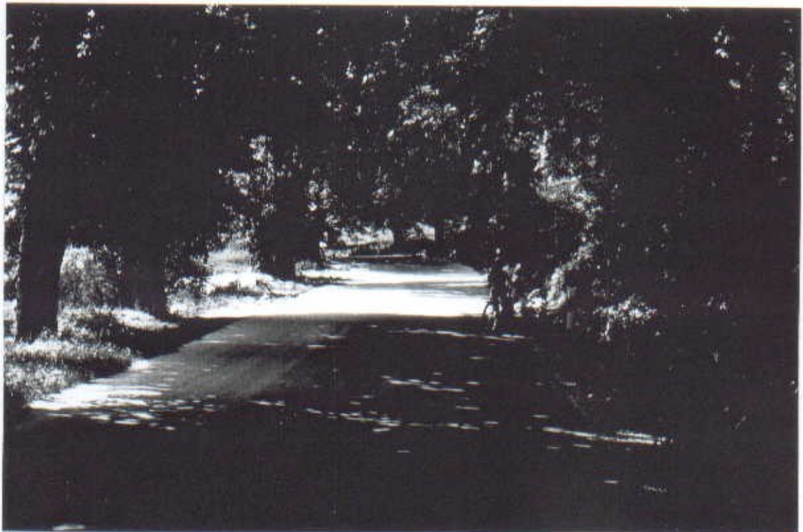
Widok alei kasztanowej od strony Klimontowa

oraz zabytkowa aleja kasztanowa najdłuższa w europie która w pogodne dni zachęca do spacerów.