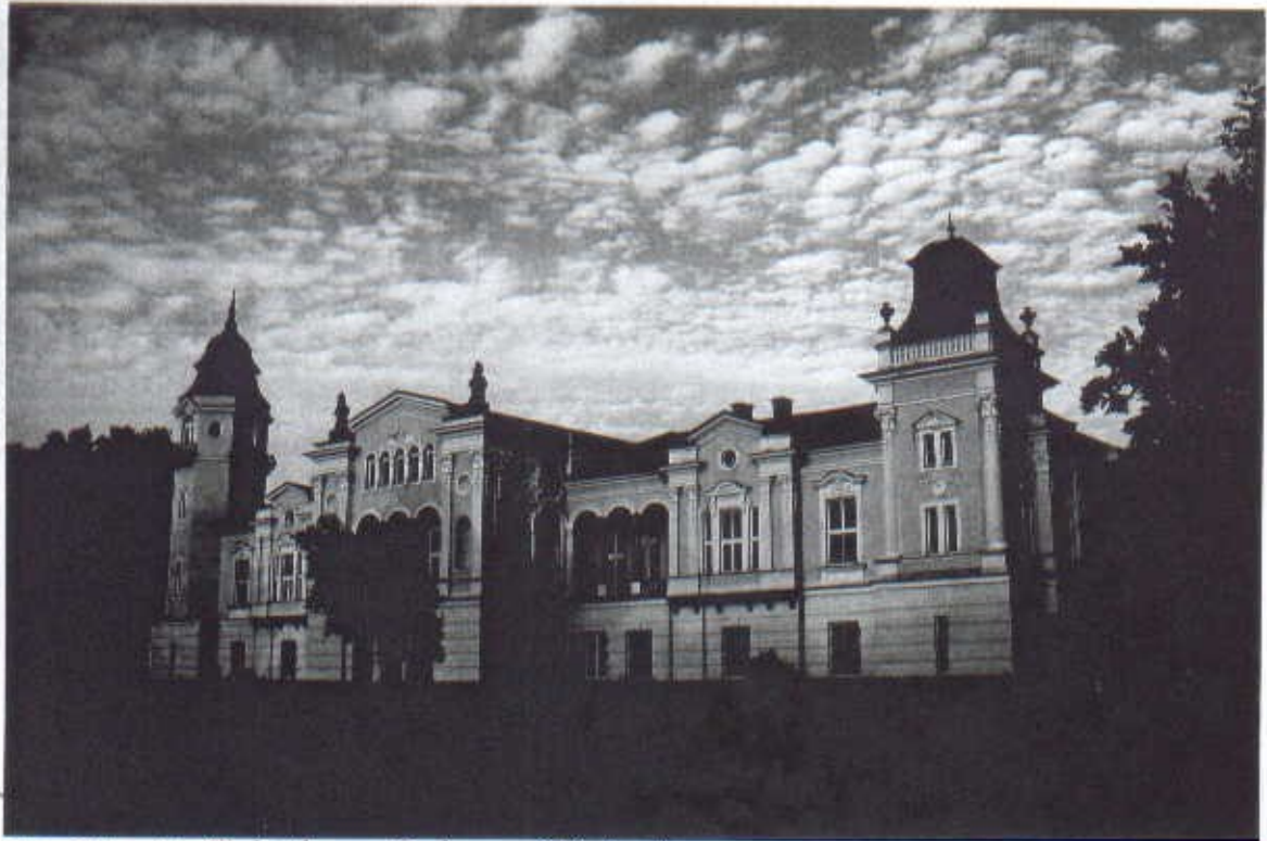
Zabytkowy Pałac w Górkach

oraz zabytkowa aleja kasztanowa najdłuższa w europie która w pogodne dni zachęca do spacerów.