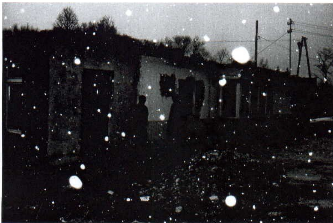
Świetlica wiejska z zewnątrz

Mieszkańcy wsi Górki planują w najbliższym czasie ( poczyniono już pierwsze kroki) założyć stowarzyszenie na rzecz rozwoju wsi Górki , planowana jest także reaktywacja Koła Gospodyń Wiejskich , które w początkowej fazie rozwoju , wezmą czynny udział w porozumieniu z Radą Gminy i Wójtem w remoncie świetlicy.