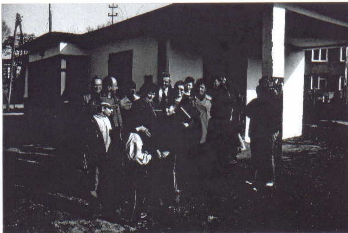
Mieszkańcy Górek wraz z władzami Gminnymi na tle remontowanej świetlicy

Marzeniem naszym jest, aby nasza wieś z powstałym zapleczem: boisko, plac zabaw, świetlica dała szansę rozwoju naszym dzieciom i młodzieży oraz nauczyła jak dbać o wspólne dobro.