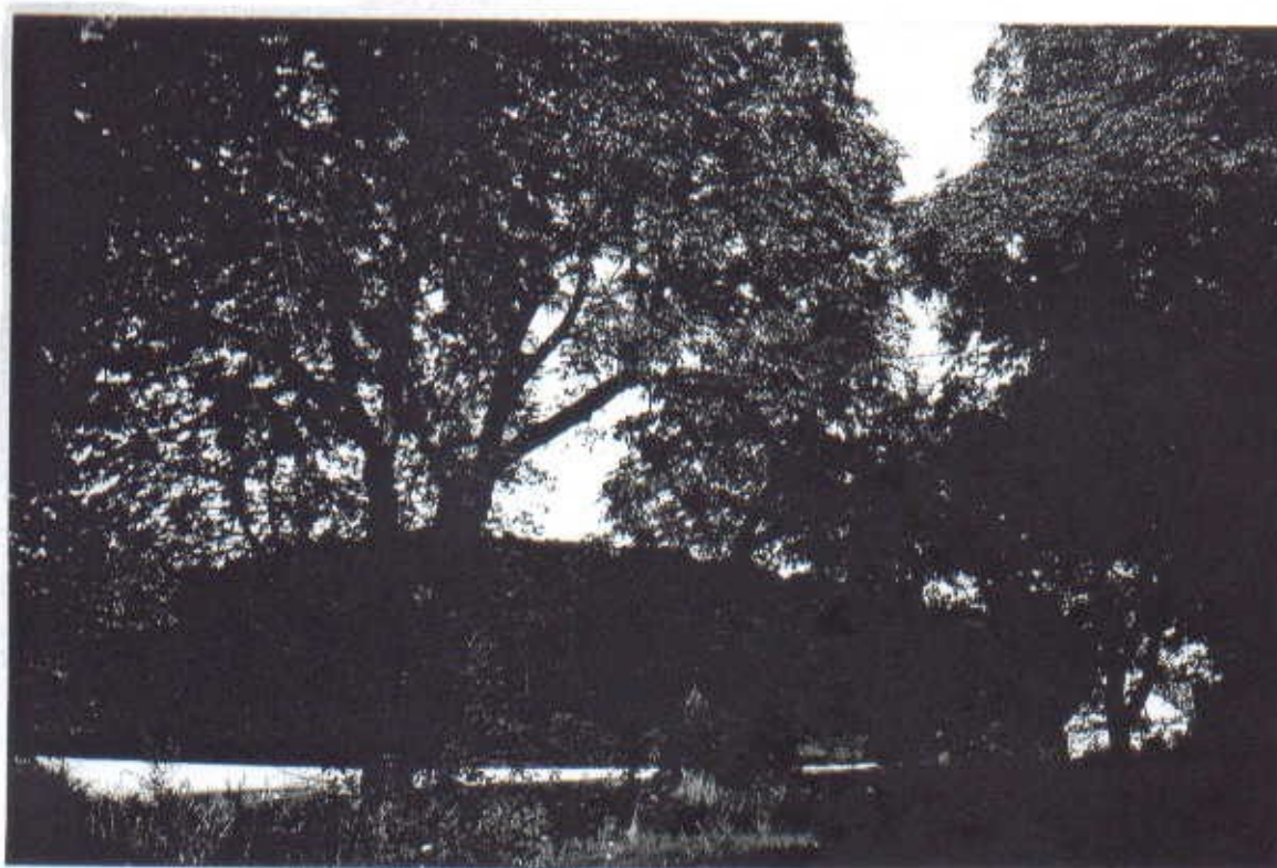
Widok alei kasztanowej od strony Górek