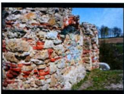
Ossolin. Ruiny zamku.