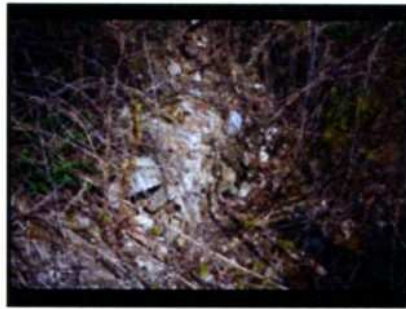
Ossolin. Ruiny zamku.