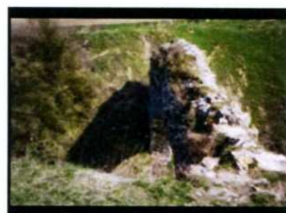
Ossolin. Ruiny zamku.