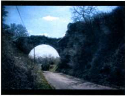
Ossolin. Ruiny zamku.