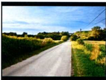
Ossolin. Ruiny zamku.

Zamek znajduje się na trasie Rowerowego Szlaku Architektury Obronnej .