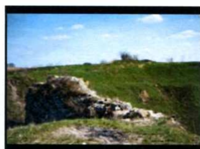
Ossolin. Ruiny zamku.