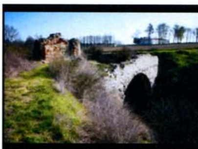
Ossolin. Ruiny zamku.