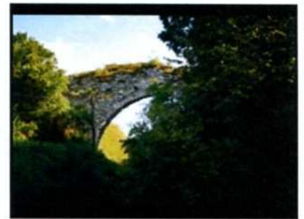
Ossolin. Ruiny zamku.