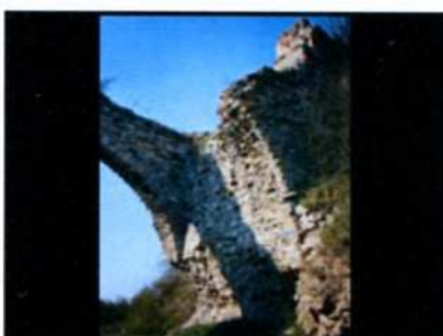
Ossolin. Ruiny zamku.