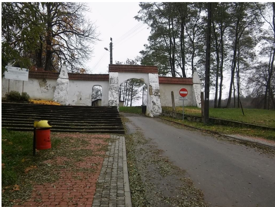
Kościół p.w. św. Jacka w Klimontowie oraz Podominikański zespół klasztorny