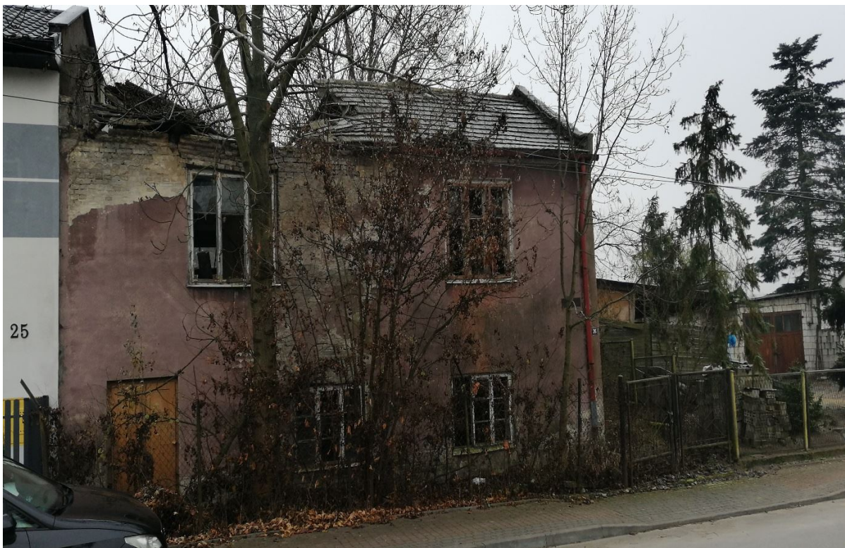
Zniszczone budynki mieszkalne w centrum Klimontowa