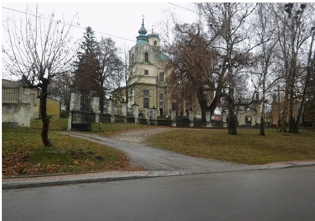
Kościół p.w. św. Józefa w Klimontowie – otoczenie wymagające zagospodarowania

Zdjęcia obszarów zdegradowanych w Klimontowie: