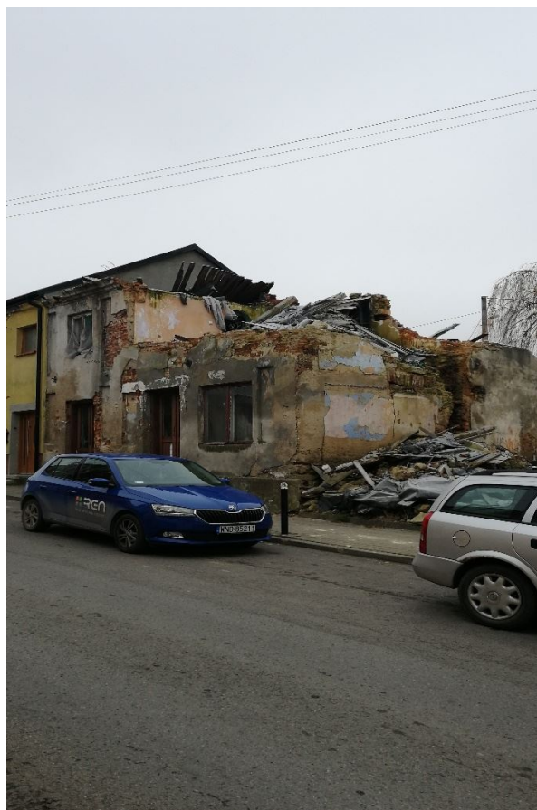
Zniszczone budynki mieszkalne w centrum Klimontowa