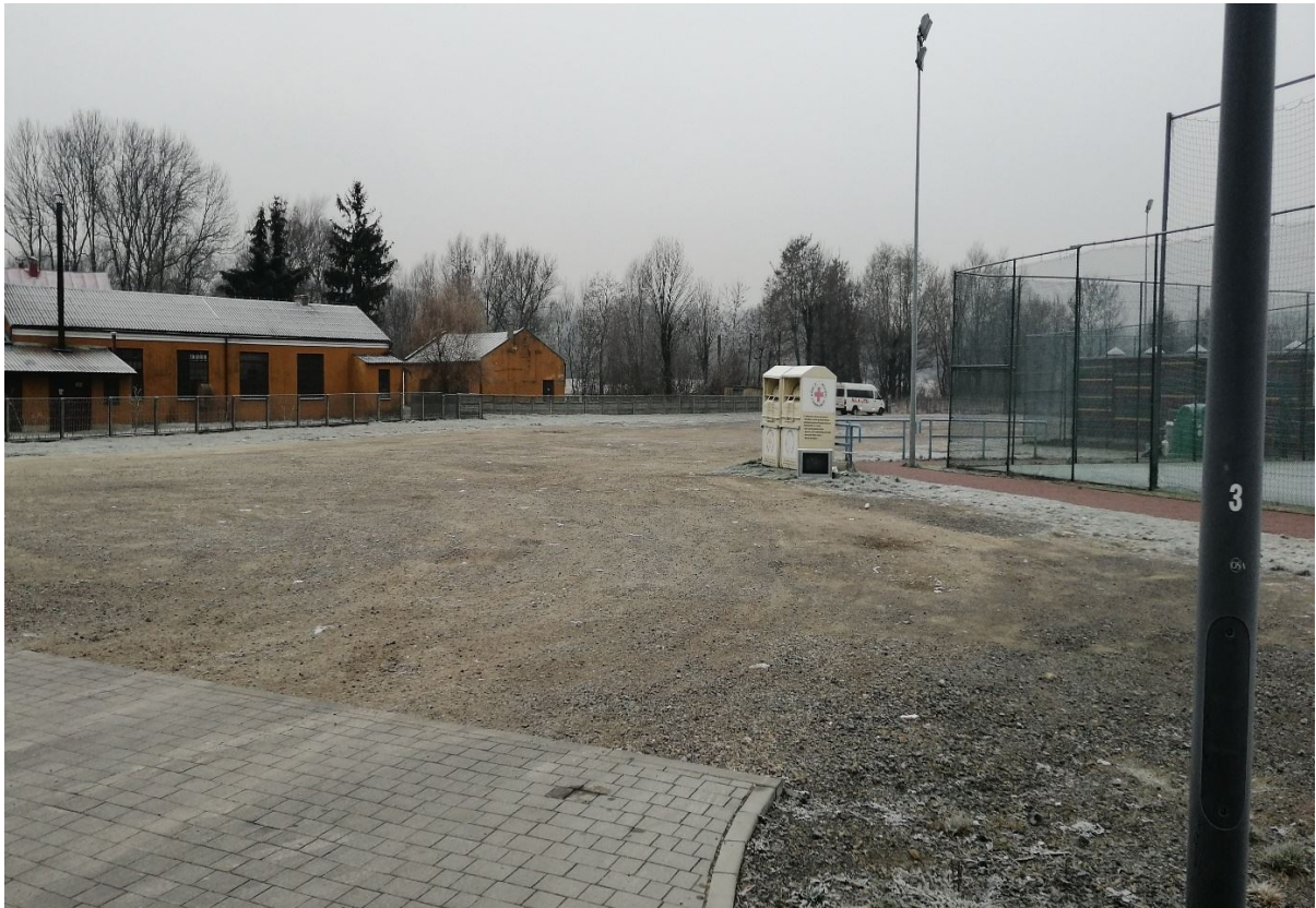
Teren wokół obiektów sportowych

Podobszary rewitalizacji w sołectwach: Beradz, Byszów, Konary, Nasławice, Pokrzywianka, Nawodzice swym zasięgiem obejmują centralne części sołectw. Na obszarach tych zlokalizowane są obiekty użyteczności publicznej m.in.: remiza OSP Beradz; remiza OSP Byszów; remiza OSP Konary; remiza OSP Nasławice; remiza OSP Pokrzywianka; budynek Szkoły Podstawowej w Nawodzicach. Jednocześnie na obszarach tych występują negatywne zjawiska społeczne (bezrobocie, przemoc, niekorzystna sytuacja demograficzna, duża liczba osób korzystających z pomocy OPS w Klimontowie) oraz gospodarczej, przestrzenno-funkcjonalnej, technicznej i środowiskowej. Obszary te jednocześnie mają istotne znaczenie dla rozwoju gminy. Tym samym podobszary rewitalizacji wyznaczone w granicach sołectw: Beradz, Byszów, Konary, Nasławice, Pokrzywianka, Nawodzice posiadają charakter wielofunkcyjny i spełniają szereg istotnych funkcji (m.in. administracyjne, gospodarcze, usługowe, społeczne, mieszkaniowe, rekreacyjne i turystyczne). Jest to zatem obszar o znacznym potencjale wewnętrznym i niezwykle ważnym znaczeniu dla rozwoju społeczno-gospodarczego całego obszaru gminy Klimontów. Niemniej ze względu na występowanie różnych zjawisk kryzysowych obszar ten wymaga wsparcia w ramach procesu rewitalizacji w celu wyeliminowania lub ograniczenia problemów i barier rozwojowych oraz wzmocnienia jego wewnętrznego potencjału rozwojowego.